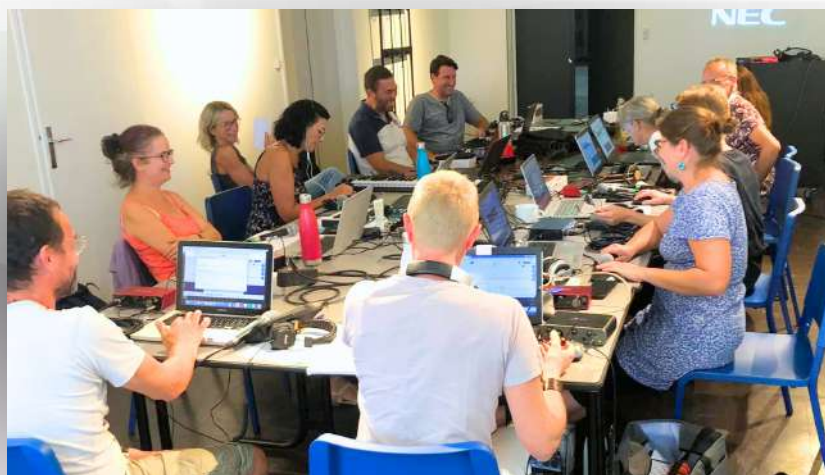
Formation au CRD de Mâcon - Septembre 2023