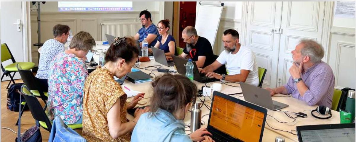
Formation à l'École de musique du pays d'Hericourt - Juillet 2023

Il est spécialisé dans le domaine du RGPD, de la formation musicale et de l'évaluation.